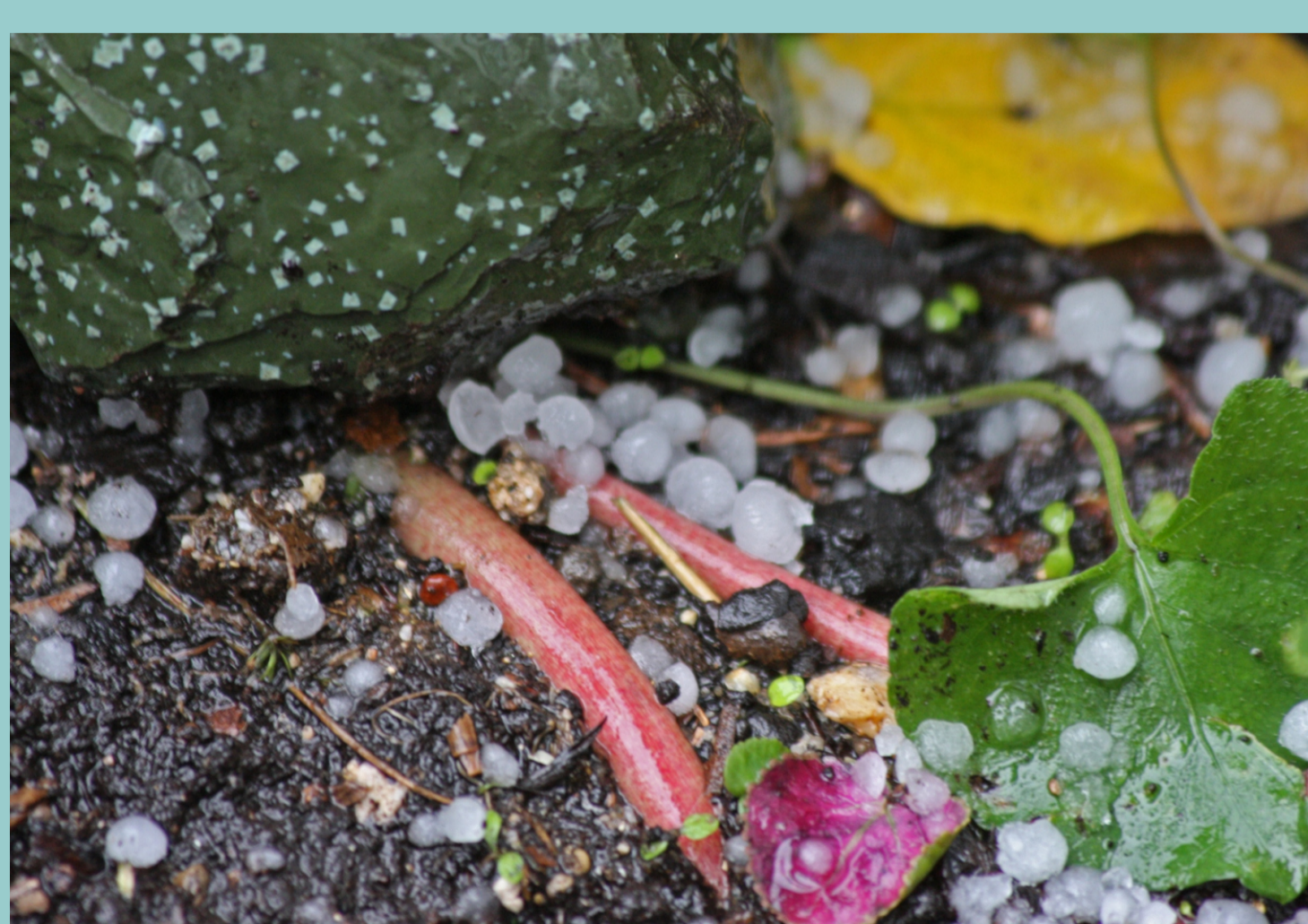
Pedrisco, saraiba, pedra ou pedrazo