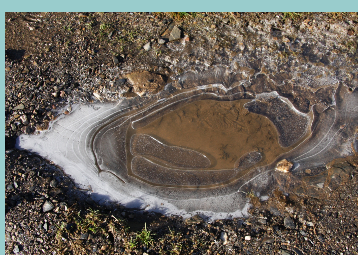
Lazo ou cristal (tona de xeo na auga)