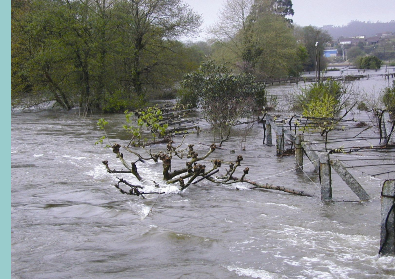
Despois de moito chover veñen as enchentes.