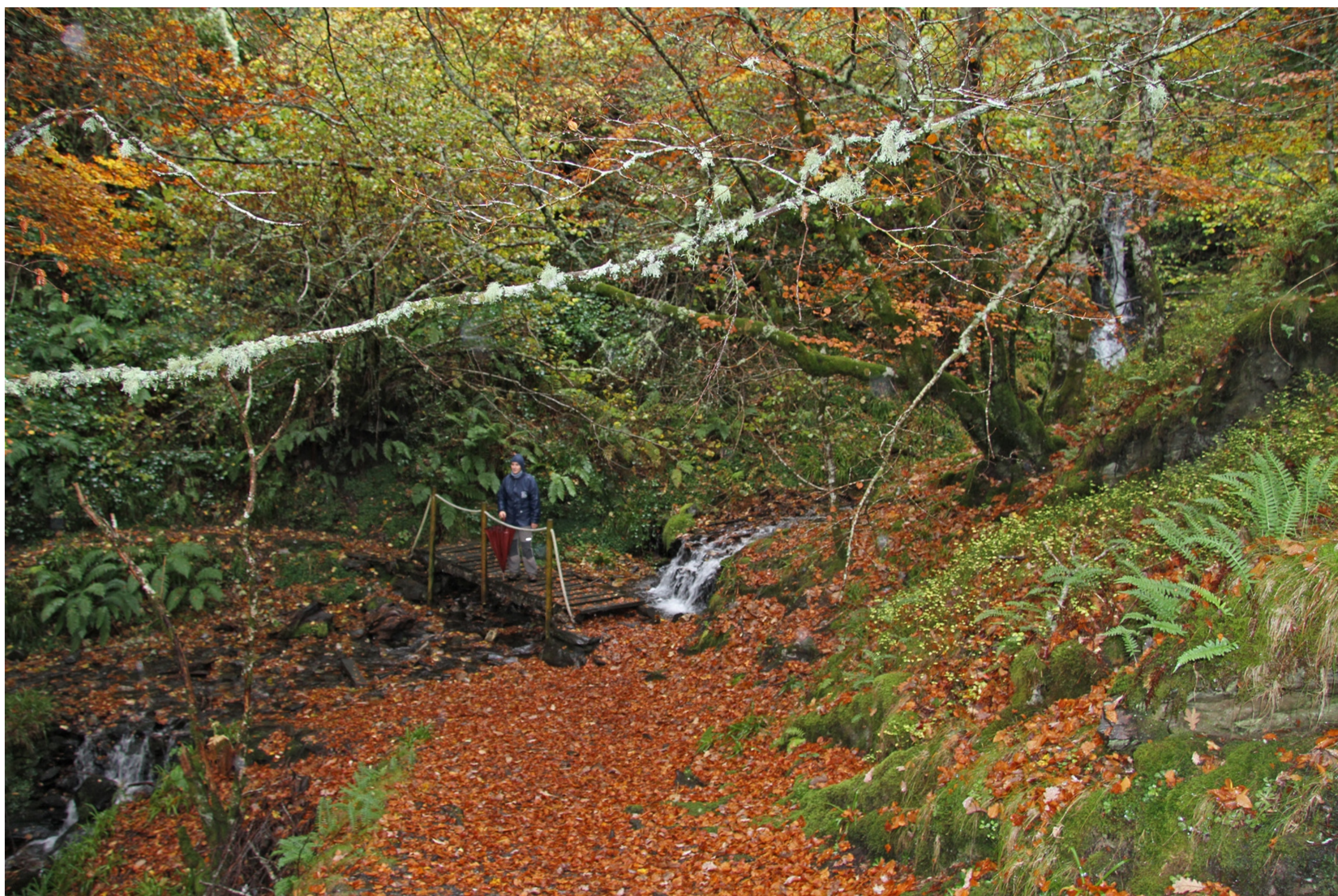
A chuvia moi miúda, con pingas moi finas, como néboa, chámase, segundo os lugares: chovisca, poalla, barruzo, orballo, bromorio, molura, cerceno, babazo, moruxeira, marmuxeira, marmaña, mocalas, mollaparvos, mollapitos...