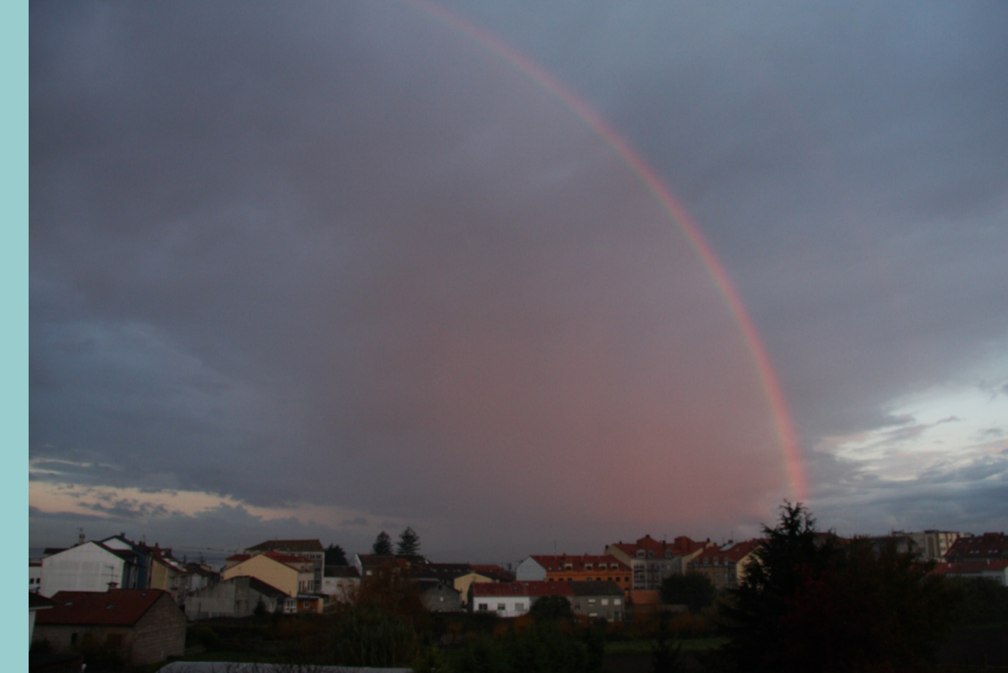
Segundo a crenza popular, o arco da vella baixa a beber auga dos ríos. Tamén se di que onde remata o arco da vella hai un illó.