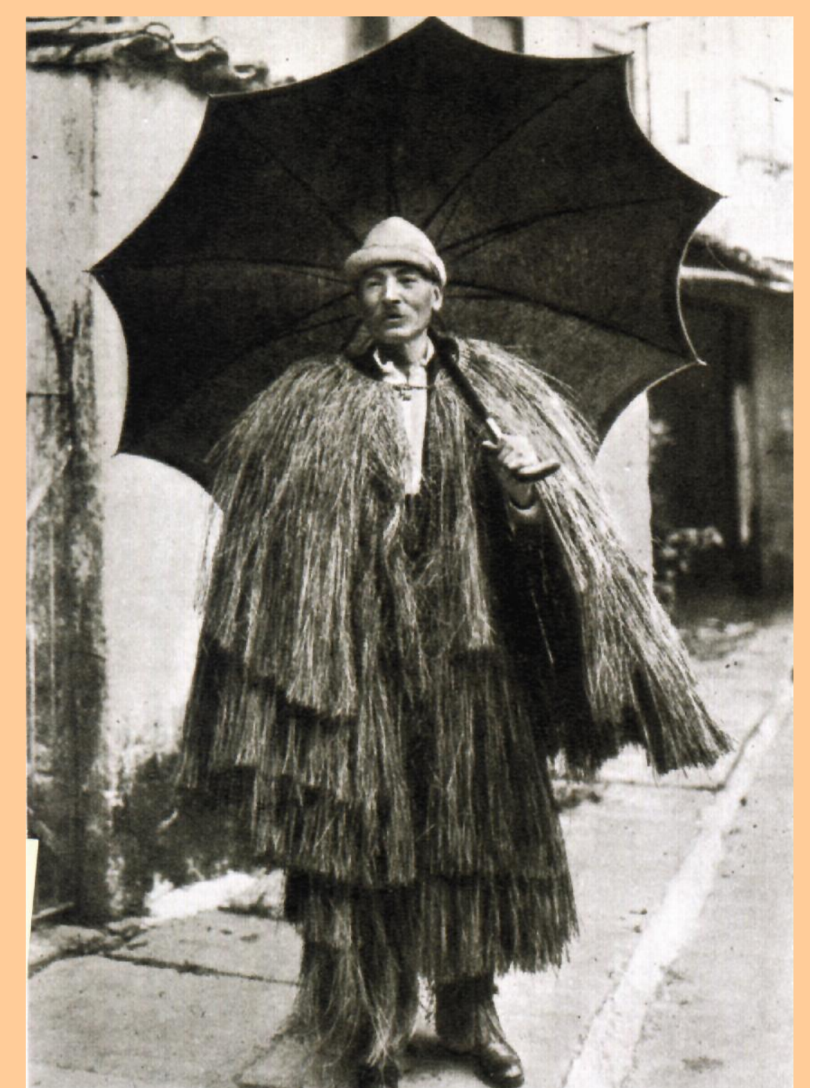
ARTESANÍA DA CHUVIA A corozá é unha prenda feita de xuncos ou palla construída de xeito que a auga esvara por ela. Foi moi empregada na montaña.