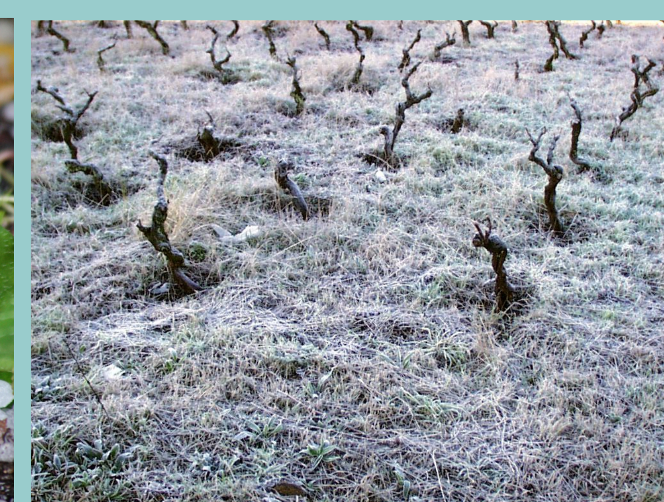
Xeada: o frío das noites de inverno conxela as minúsculas pingas da humidade do aire.