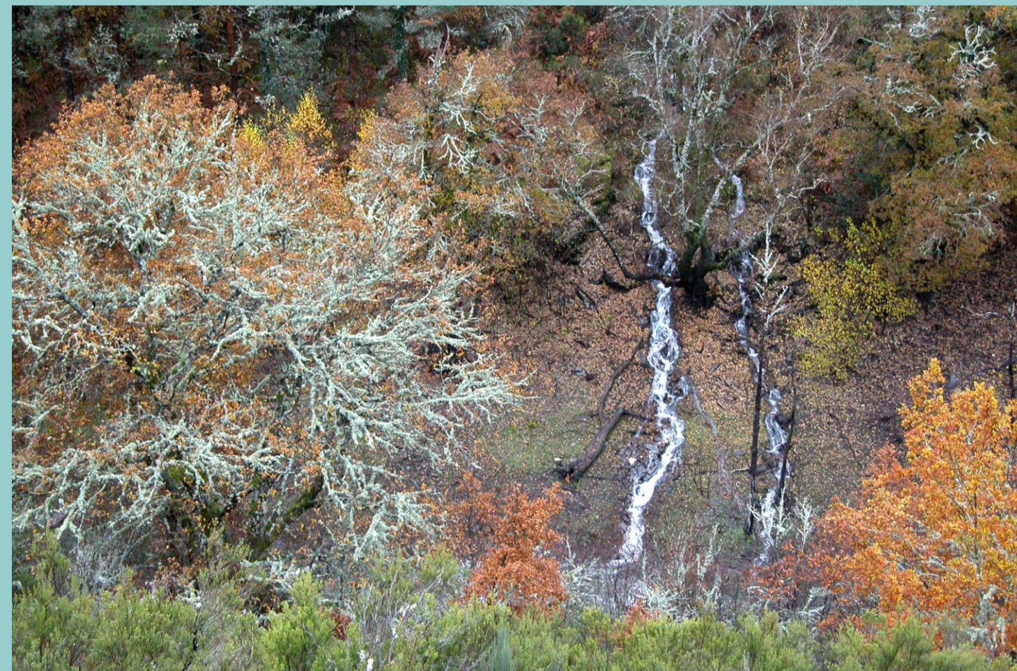
A xurrada ou escorrentía é a auga que corre por enriba da terra cando chove.