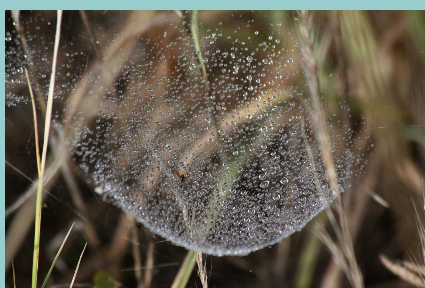
O orballo ou rosada fórmase nas noites frescas ao condensarse o vapor de auga do aire