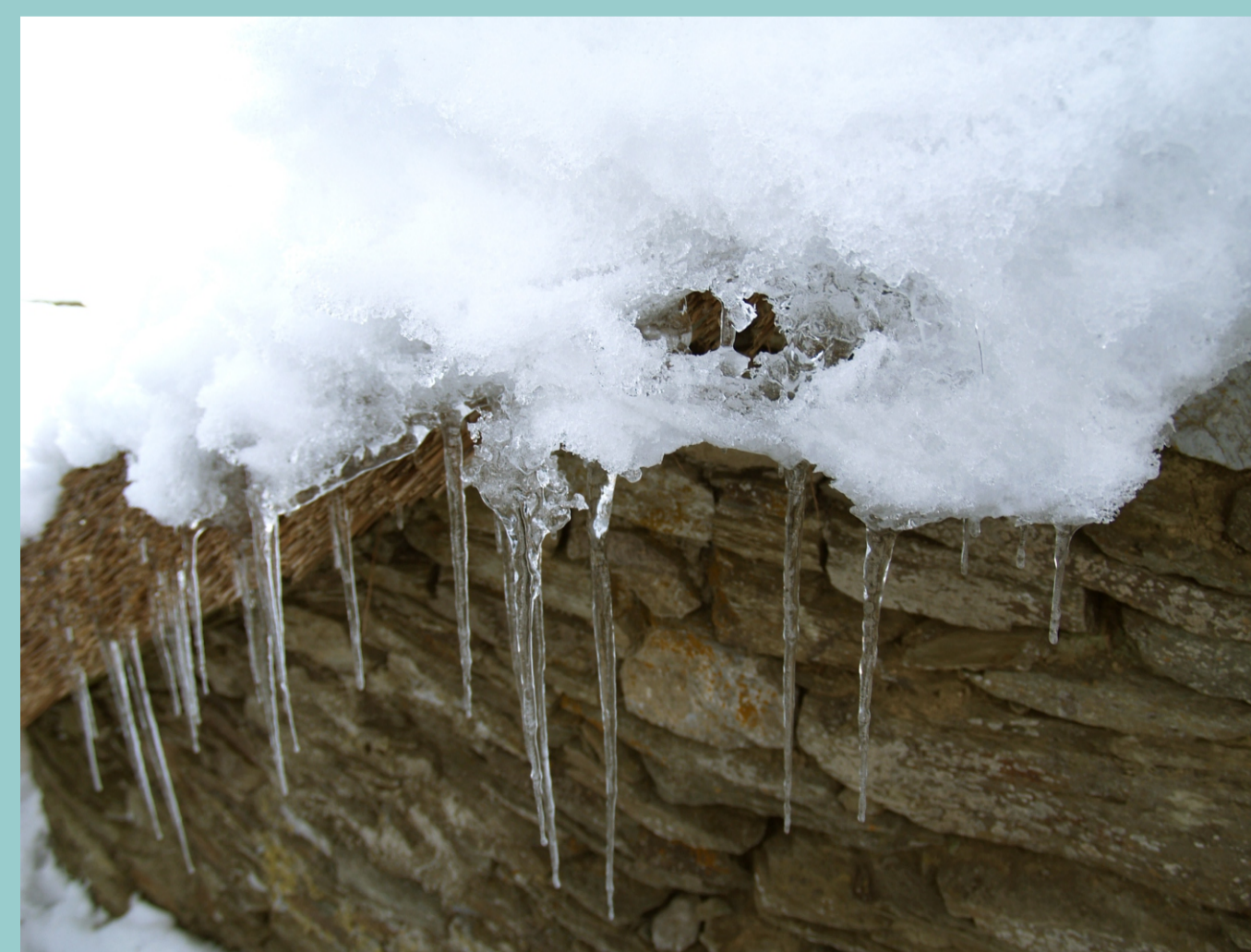
O frío converte en carambelos as pingas de auga que esbaran dos