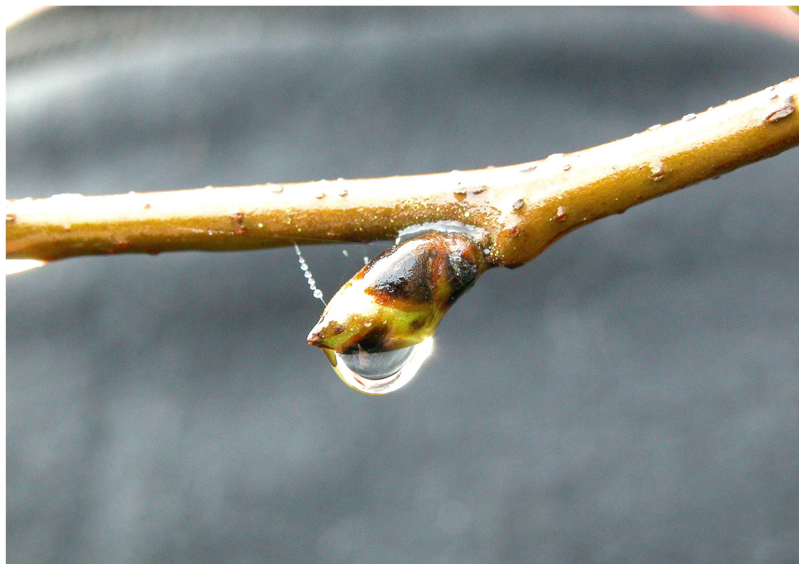
Despois de escampar, estiñar, estrelampar ou clarear as derradeiras pingas esvaran polas ponlas das árbores.

Seres que se encargan de fabricar a tronadas e saraibas. Homes altos vestidos de negro que falan castelán e forman as treboadas subindo ás nubes por medio dunha polvorina que fabrican mexando no pó. Tócanse as campás para espantalos e que non fagan dano na parroquia. Os curas espantanos con resposos.